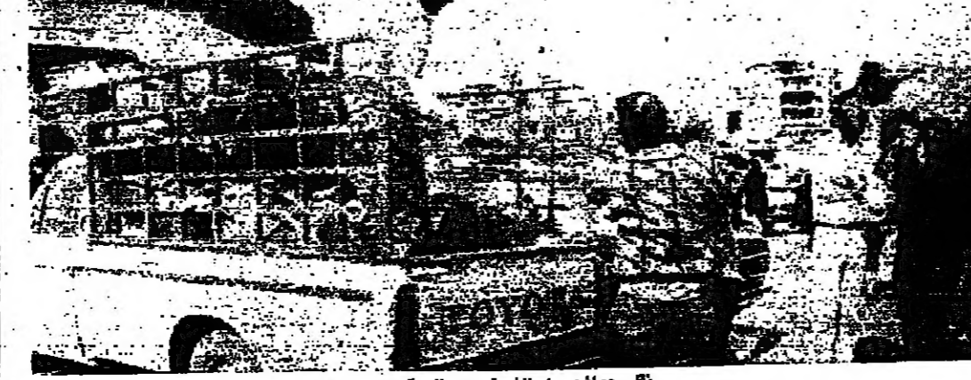
تقل حوانجك من النجمة عبر الصالون